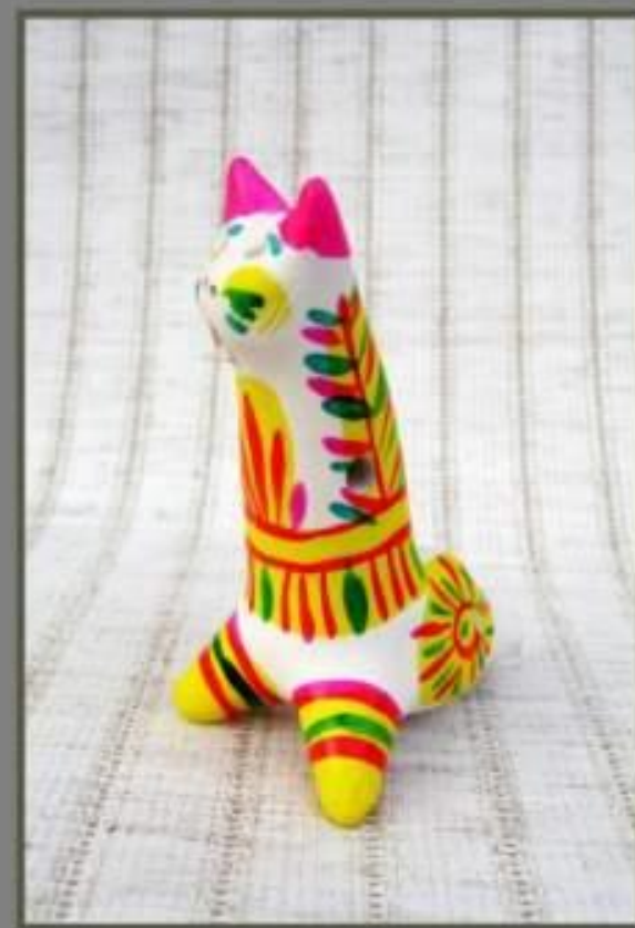
свисток 7 см.